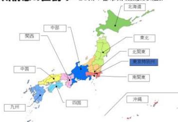
○州構想の区割り～10州+都市州（東京、大阪）

私達の日常は、経済も生活も県境に関わりなく広いフィールドで行われている。地方自治のエリアは実際都市と行政都市が一致していることが大原則だ。だが現在の47都道府県体制はそこから大きくズレ、社会の広域化が進む一方で各府県域は狭域化している。拡大した実際都市（圏）に合う新たな行政都市（圏）の創設、人口大減少のトレンドを加味した広域自治体の再構築は待ったなしだ。47都道府県という旧体制を解体再編し、広域圏を単位に約10の州をつくり、日常生活にあった広域圏行政の仕組みを創る。それが道州制である。47都道府県体制に代わる10州体制を図示した。